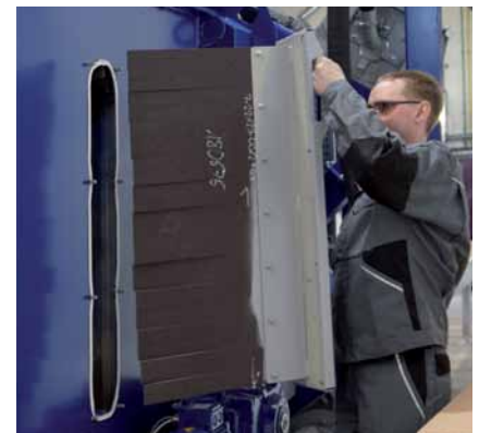
Wartungsfreundlicher Tausch der Gummilamellen