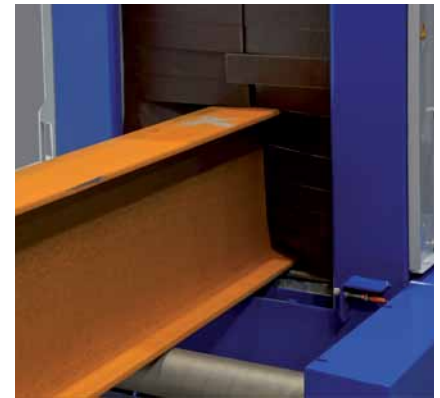
Perfekte Abdichtung des Einlaufs