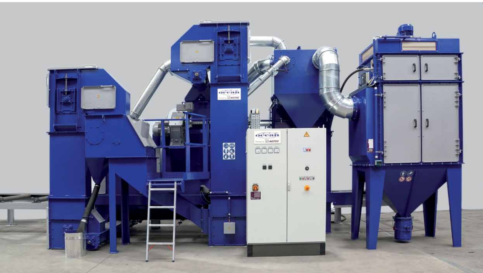
Die Seitenansicht verdeutlicht die kompakte Bauweise des „Ocean Blasters“.

Nachdem sich ein Bedarf zu Strahlmaschinen auch für kleinere Betriebe in der Stahlbranche abzeichnete, reagierte AGTOS in Zusammenarbeit mit seinem Partner Ocean Machinery inc. mit der Entwicklung einer Maschine, die diesem Bedürfnis nachkommt. Ziel war es eine Rollbahn-Strahlanlage für Betreiber zu entwickeln, die kleine und zudem niedrige Hallen haben. Der „Ocean Blaster“ erfüllt diese und noch weitere Voraussetzungen.