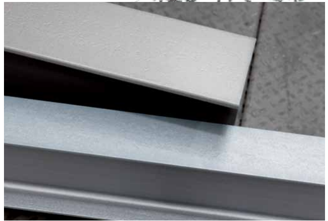
... und nach der Bearbeitung