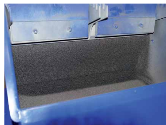
Die Windsichtung entfernt Staub und Unterkorn aus dem Strahlmittel.

Die zu bearbeitenden Werkstücke können bis zu 1000 mm hoch und 500 mm breit sein. Im Vergleich zu herkömmlichen Maschinen haben die Ingenieure von AGTOS den „Ocean Blaster“ in einer sehr kompakten Version ausgeführt. So gelang es, Platzvorteile zu generieren. Selbst die Anlagenhöhe ist mit 4,1 Metern auffallend niedrig. Damit ist die Maschine auch in kleineren Produktionshallen ohne Fundament einsetzbar. Zudem ist die Maschine bedienerfreundlich gestaltet. Eine Wartungsbühne ermöglicht die Bedienung der Windsichtung. Passend dimensionierte Wartungsöffnungen stellen den einfachen Zugriff auf Verschleißteile sicher.