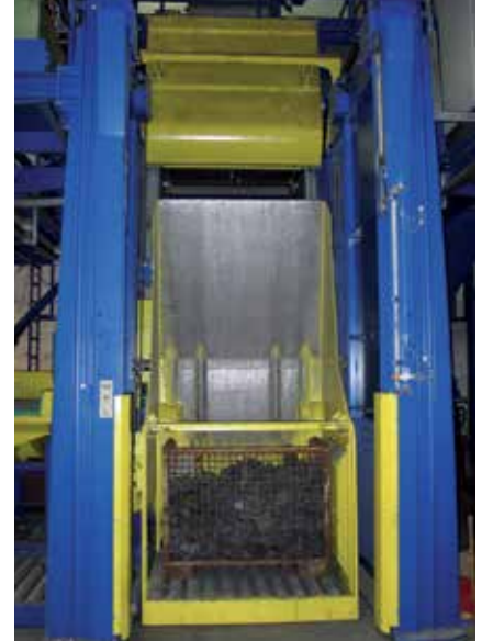
AGTOS -Raupeband-Strahlanlage MR-850