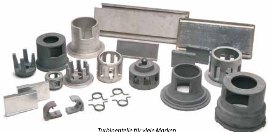
Turbinenteile für viele Marken