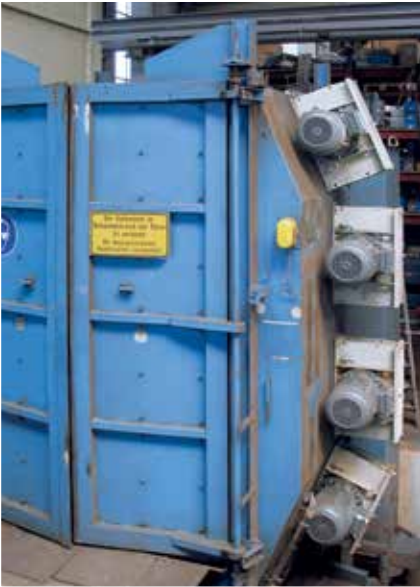
AGTOS-Hochleistungsturbinen werden häufig zur Leistungssteigerung älterer Strahlmaschinen eingesetzt, hier z. B. an einer Hängebahn-Strahlanlage.