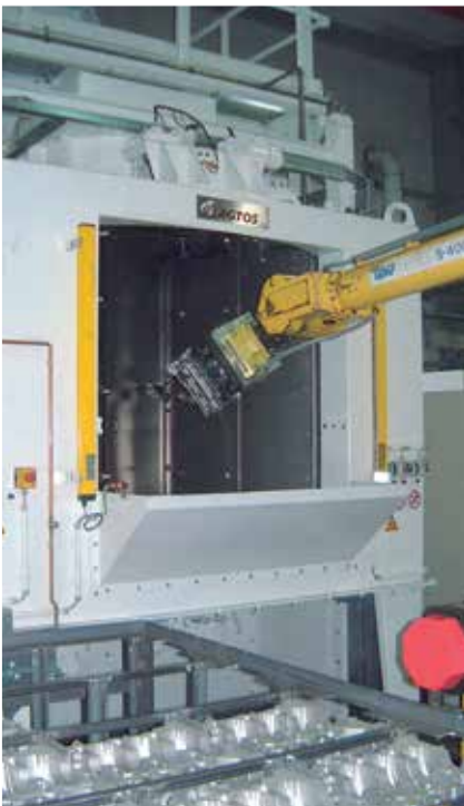
Automatisierte Satelliten-Taktdrehtisch-Strahlanlage für Gussteile.

Das Thema Gussputzen und Formenstrahlen nimmt einen hohen Stellenwert in der Oberflächentechnik ein. Auf diesem Gebiet haben wir Erfahrung. So entwickeln und liefern wir neben Strahlmaschinen in vielen Typen und Ausführungen auch komplette Anlagen nebst Kühlstrecken, Transportsystemen und Putzarbeitsplätzen. Hinzu kommen gebrauchte Strahlmaschinen, Service und Ersatzteile.