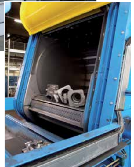
Raupeband-Strahlmaschine mit Schmiedeteilen

Das Thema Gussputzen und Formenstrahlen nimmt einen hohen Stellenwert in der Oberflächentechnik ein. Auf diesem Gebiet haben wir Erfahrung. So entwickeln und liefern wir neben Strahlmaschinen in vielen Typen und Ausführungen auch komplette Anlagen nebst Kühlstrecken, Transportsystemen und Putzarbeitsplätzen. Hinzu kommen gebrauchte Strahlmaschinen, Service und Ersatzteile.